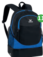
RUCKSACK MIT BODENFACH

Kinder: Gr. 128-164 € 46.- Erwachsene: Gr. S-XXXL € 56.-