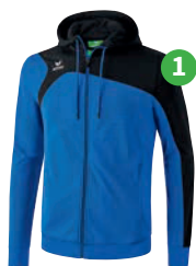
TRAININGSJACKE MIT KAPUZE